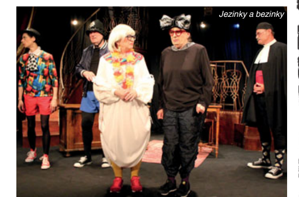
Jezinky a bezinky

K 55. výročí Studia Ypsilon připravujeme v návaznosti na předchozí Cestu Ypsilon knihu, která shrnuje posledních pět let divadla. DIVADLO VZÁJEMNOSTI. Je pozoruhodné, že poetika Ypsilonu oslovuje už skoro třetí generaci, která, přestože nahlíží svět jinak, je s ní v souladu. Jan Schmid