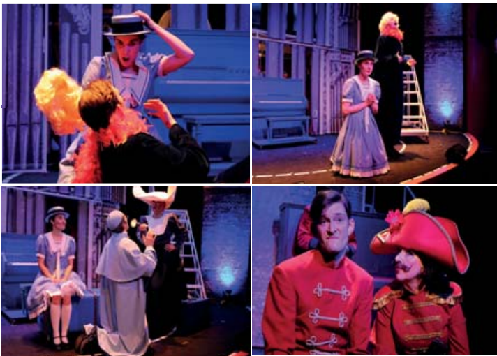
Lubomír Feldek Florimond Hervé