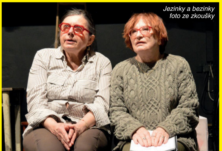
Jezinky a bezinky foto ze zkoušky

Právě těchto myšlenek je dobré se držet.