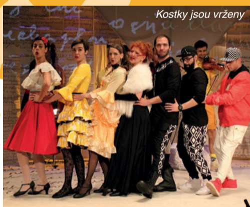
Kostky jsou vrženy