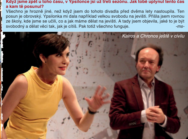
Kairos a Chronos ještě v civilu