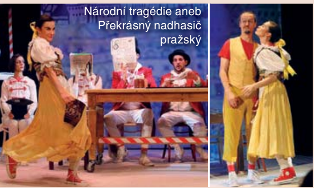
Národní tragédie aneb Překrásný nadhasič pražský