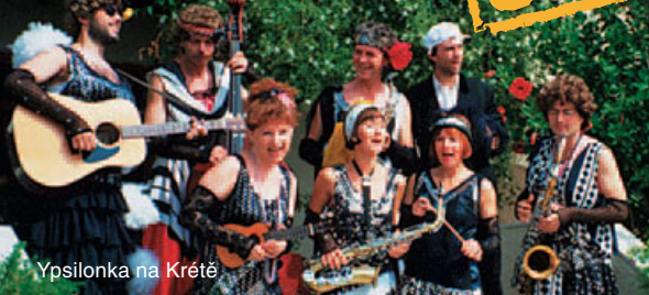
Ypsilonka na Krétě