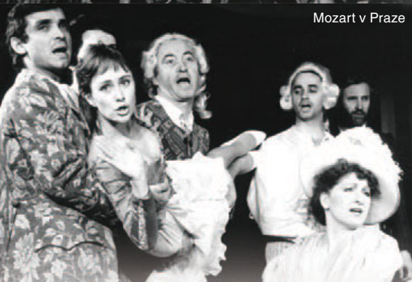
Mozart v Praze